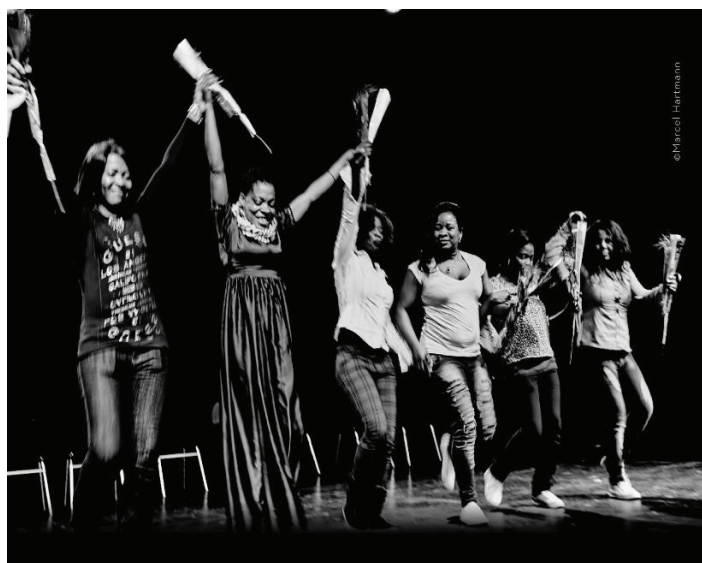
Actrices de la pièce de théâtre "Nigerian drama"

C'est un travail très long qui commence déjà par l'information et l'accès aux soins d'où le guide Hustlers - Health and freedom disponible à la FASTI si besoin. Afin de comprendre le phénomène et de changer de regard sur l'exploitation sexuelle, les femmes nigérianes de l'association ont créé la pièce de théâtre Nigerian drama : Feeling free is not enough, n'hésitez donc pas à organiser leur venue !