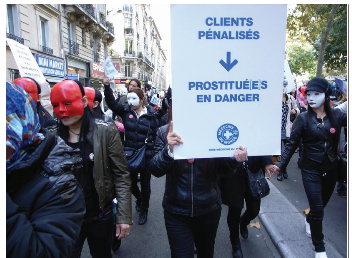
Manifestation contre La Loi du 13 Avril 2016, © Hélène Le Bail.

Il est donc important en tant que militant-e associatif-ve de continuer de porter le message de la liberté de circulation et d'installation avant tout !