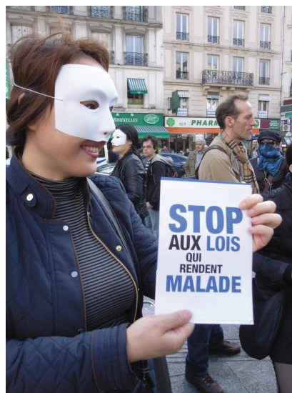
Manifestation contre La Loi du 13 Avril 2016

Pour certaines femmes, le recours à l'asile qui ouvre plus de droits peut être une autre possibilité étant donné les risques de persécution liés à la traite si elles retournent dans leur pays d'origine, notamment pour les personnes venant du Nigéria, d'Ukraine, d'Albanie ou de Guinée. L'enjeu pour nous réside dans la détection des personnes accueillies qui peuvent être victimes de TEH. Parfois, les cas de traite se retrouvent dans des cas de violences conjugales par exemple.