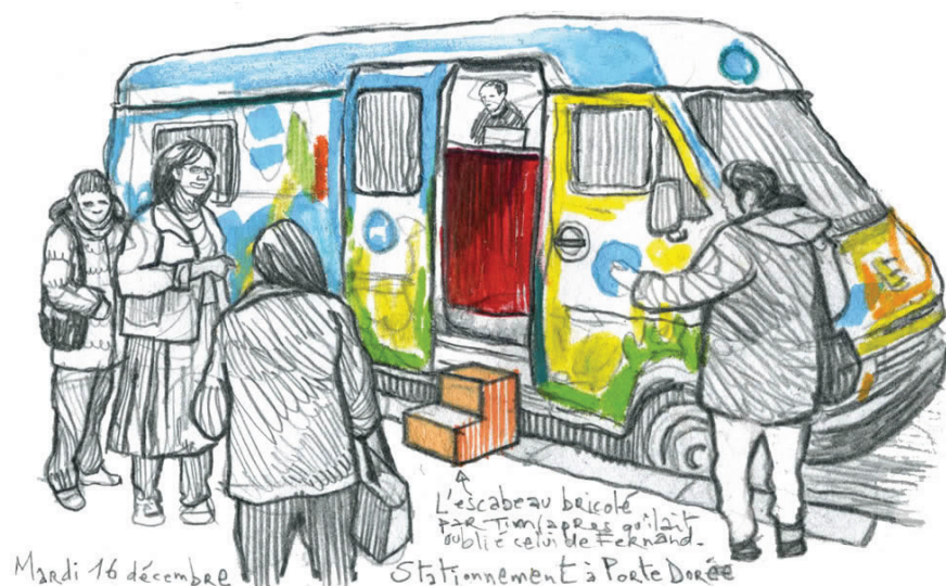
Dessin du Lotus Bus, Damien Rondeau.

Au nom de la lutte contre la traite des êtres humains et le proxénétisme, on a généré de l'exploitation puisqu'on a limité le pouvoir des personnes. Ce sont autant de choses que nous avons démontré avant la loi car les expériences étrangères l'illustrent et car toute forme de répression génère des problèmes pour les femmes migrantes : plus de précarité, plus de prises de risques et plus de violences. Contrairement à ce qui a été annoncé, les clients se sentent dans une situation de pouvoir vis-à-vis des travailleuses du sexe car il y a moins de concurrences et se permettent plus de demander des rapports sexuels non protégés. Le fait qu'il nous a été impossible de mobiliser une travailleuse du sexe chinoise ce soir relève aussi de ces raisons : elles passent beaucoup plus de temps à travailler, à attendre les clients pour moins d'argent. Les contacts avec elles sont donc rendus plus compliqués.