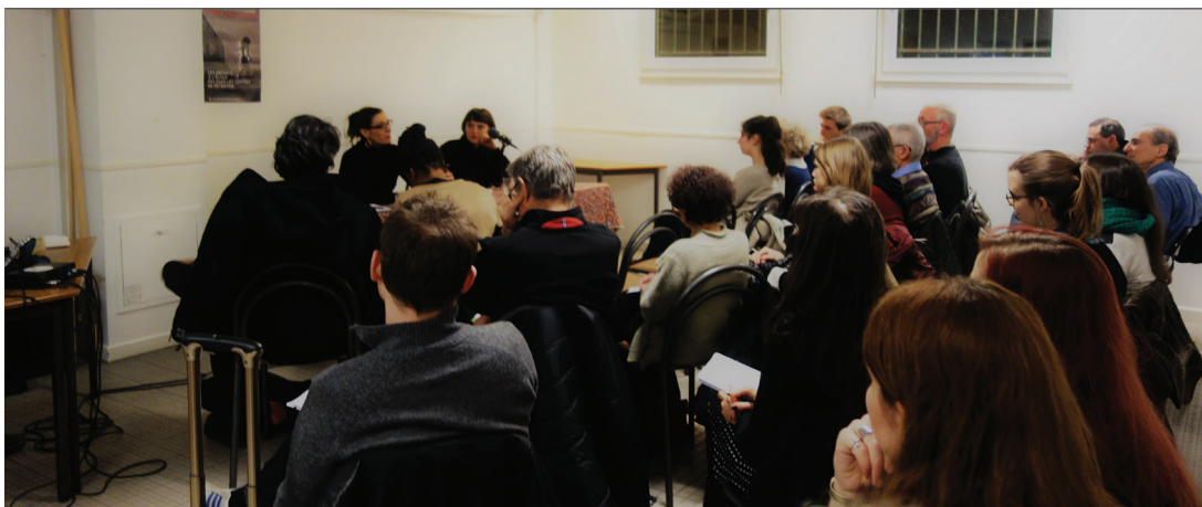
Rencontre du 9 décembre 2016 à la FASTI

Il est important de souligner la différence dans la continuité entre les deux lois de 2003 et 2016 : en 2003 la priorité était l'ordre public. On ne voulait pas voir ces gens dans la rue alors qu'en 2016, on met en place des dispositifs répressifs mais au nom des droits des femmes. Il serait donc intéressant de mener une réflexion à ce sujet, comme le fait l'anthropologue américaine Elisabeth Bernstein avec ce qu'elle appelle le « féminisme carcéral », c'est-à-dire un féminisme qui compte ses victoires par le nombre d'arrestations, de mesures répressives, de mises en garde à vue des « coupables » sachant que les cibles varient en fonction des causes. Le féminisme n'est pas complètement imperméable à ces logiques sécuritaires de répression et je vous invite à y réfléchir en tant que militant-e associatif-ve.