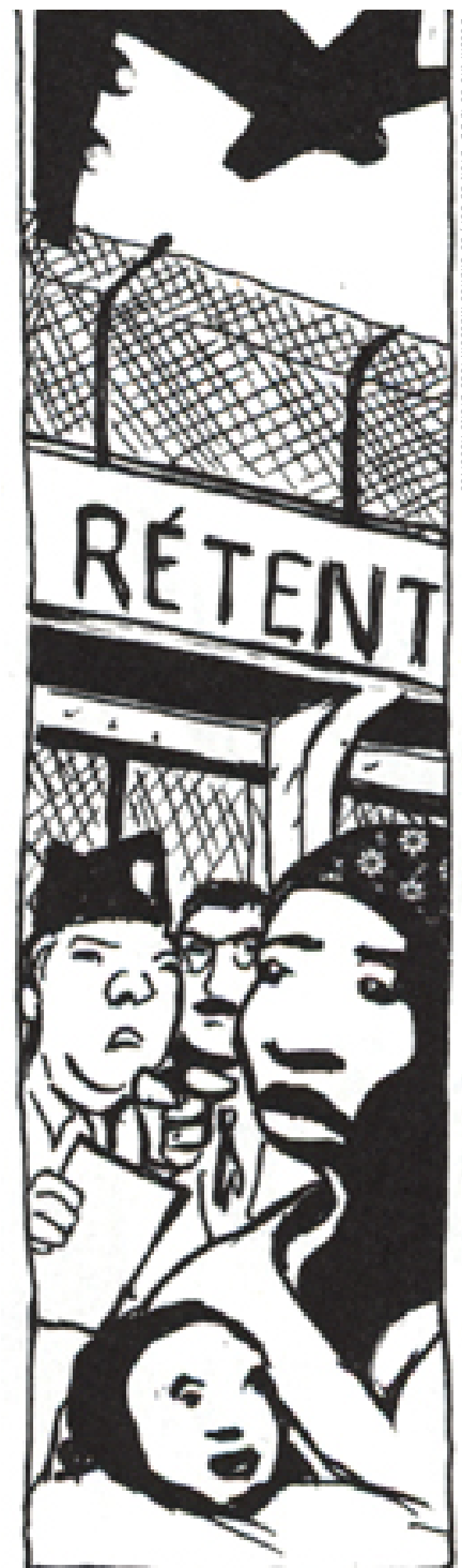
Dessin tiré de la BD "Droit du Sol" de Charles Masson. Tous Droits Réservés

Il y a quelques années, la prostitution touchait presque exclusivement les femmes malgaches pour la plupart dépourvues de droit au séjour et de liens avec la population locale. Ces dernières années, le durcissement de la politique d'immigration a aggravé la situation économique, administrative et sociale des femmes migrantes. Soumises à la répression policière quotidienne, à la précarisation extrême 2 et à l'exploitation, la prostitution devient pour de nombreuses femmes, avec ou sans papier, un des seuls moyens de survie. Ce phénomène touche également les demandeuses d'asile d'origine africaine, compte-tenu notamment de leurs conditions d'accueil. En effet, ces femmes ne bénéficient ni d'hébergement en CADA, ni d'allocation temporaire d'attente, ni de droit au travail.