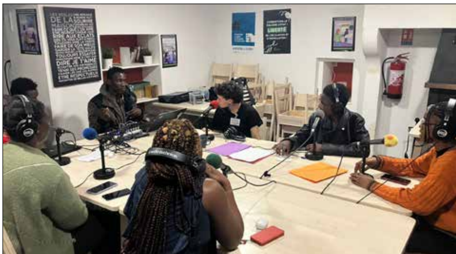
INTERVIEW COMMISSION FEMMES

Cette dynamique se poursuivra aux commissions de septembre et lors du prochain week-end de la commission jeunesse, qui aura certainement lieu les 9 et 10 novembre à Nantes :) 🐾